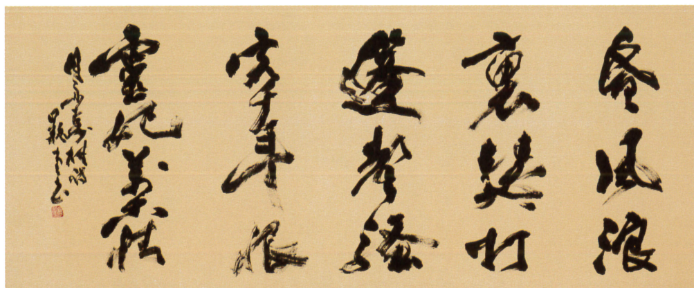
瀟湘八景の内 瀟湘夜雨 (月舟寿桂詩)