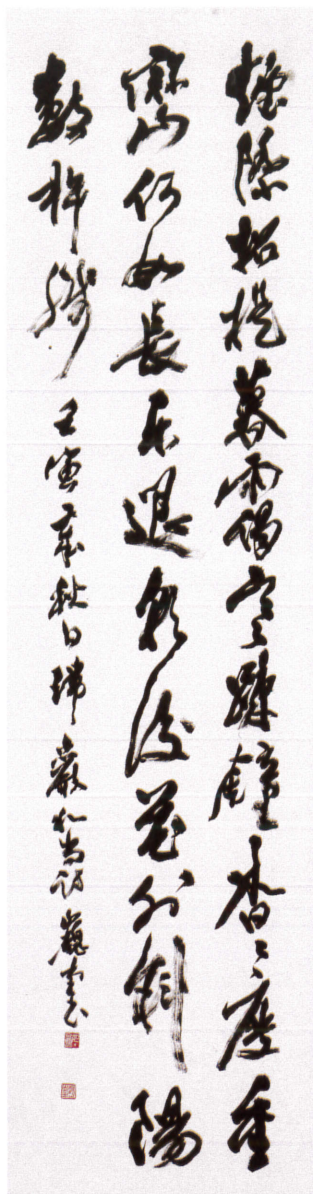
瀟湘八景の内 遠寺晚鐘 (瑞巖竜惺詩)

各展に発表の自選作品に、新しく書き下ろした新作(扁額、屏風、卷子等)計90点余を陳列いたします。